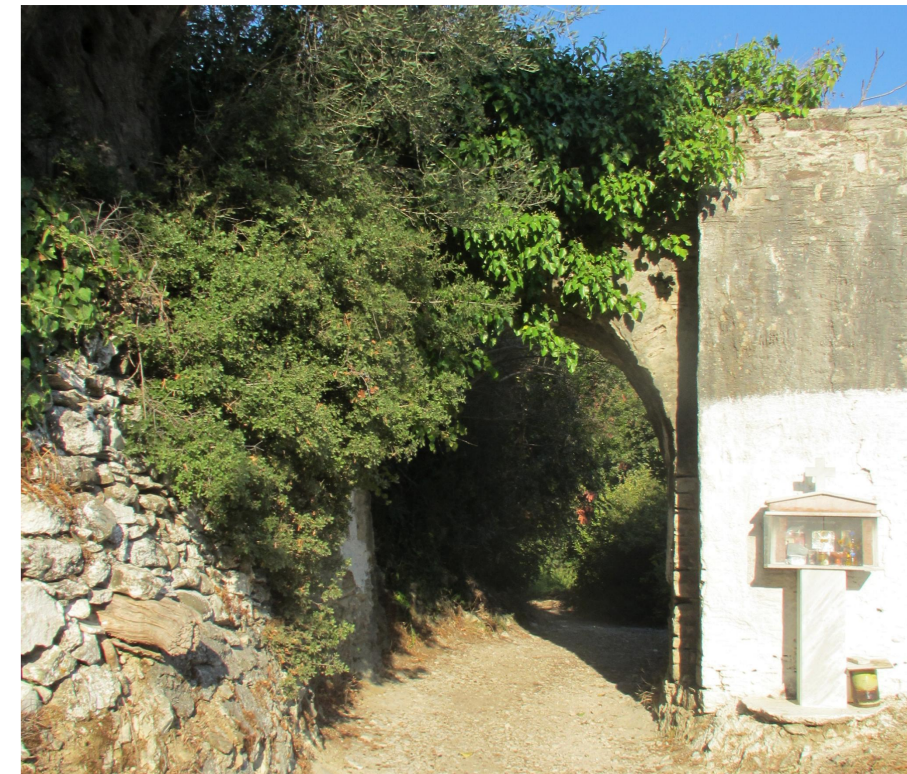
Limp Mill Arch Bogen der Hinkemühle

➤ Und wenn Sie Einheimischen bei der Arbeit oder Touristen auf der Wanderung begegnen, wie wär's mit einem fröhlichen „Kaliméra“ oder „Kalispéra“?